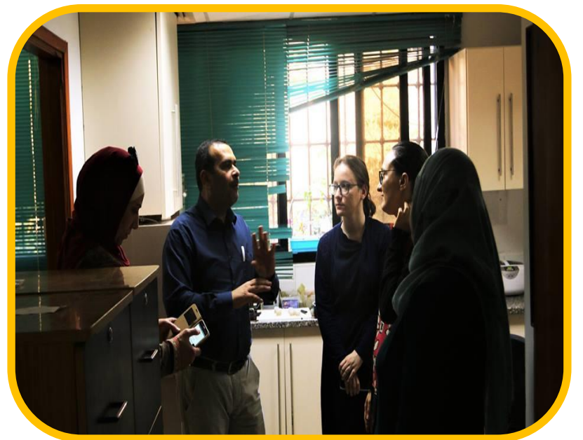
وفد من مؤسسة اليونيسيف