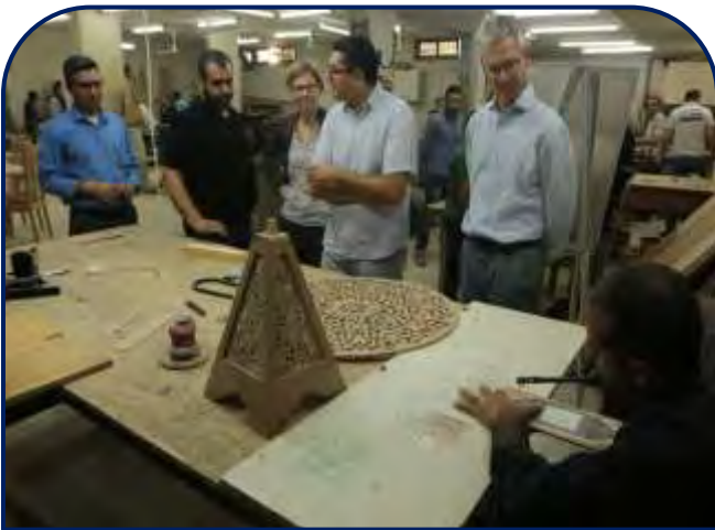
زيارة وفد من وكالة التنمية السويسرية