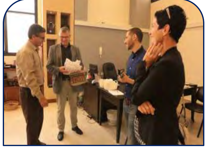
وفد من المؤسسة الألمانية للتعاون الدولي