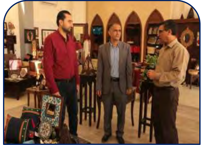
زيارة وفد من برنامج الغذاء العالمي