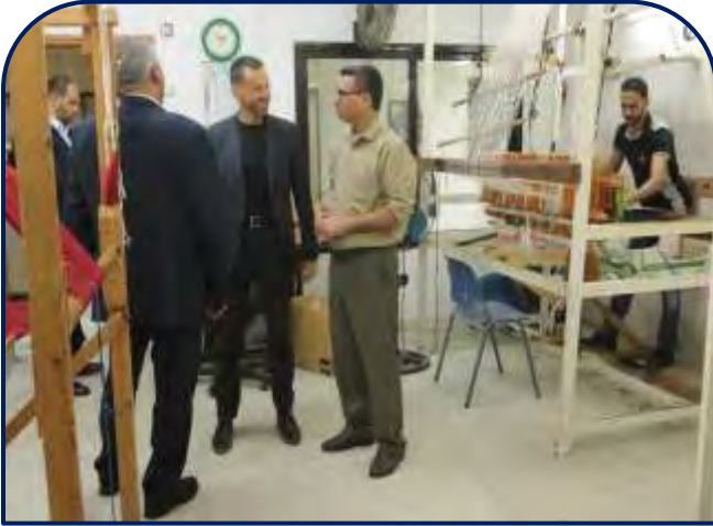
زيارة نائب سفير الاتحاد الأوروبي