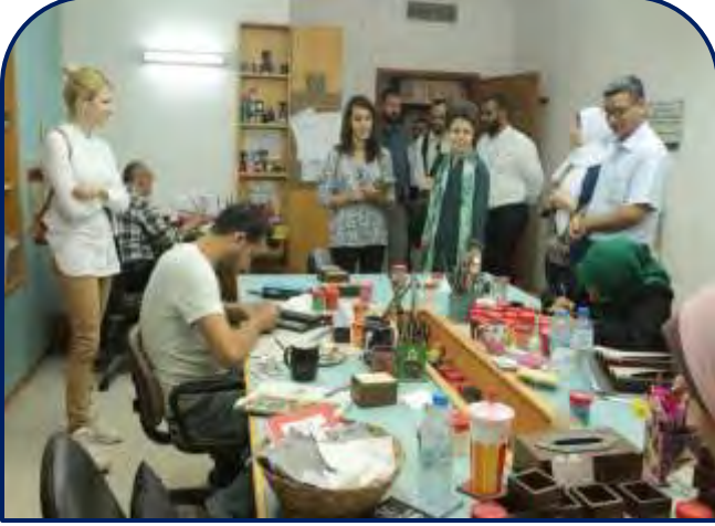
وفد من مؤسسة التعاون الانمائي السويسري