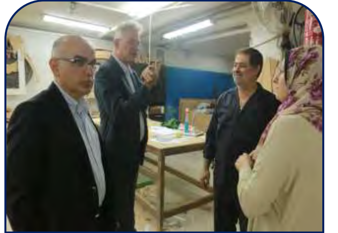
زيارة القنصل الألماني