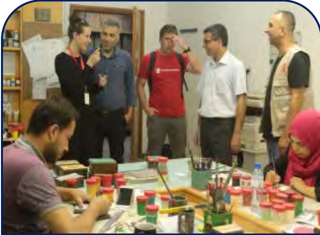
وفد من مؤسسة انقاذ الطفل