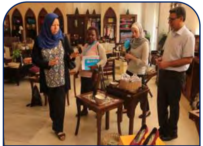
زيارة وفد من مؤسسة اليونيسيف